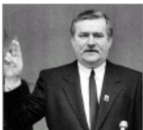
Lech Wałęsa – pierwszy prezydent Polski wybrany w demokratycznych wyborach