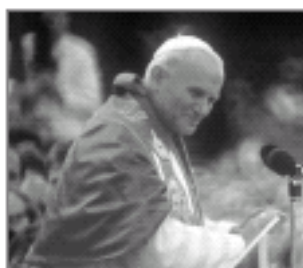
Karol Wojtyła – papież Polak